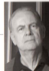
CATHERINE HÉLIE © ÉDITIONS GALLIMARD